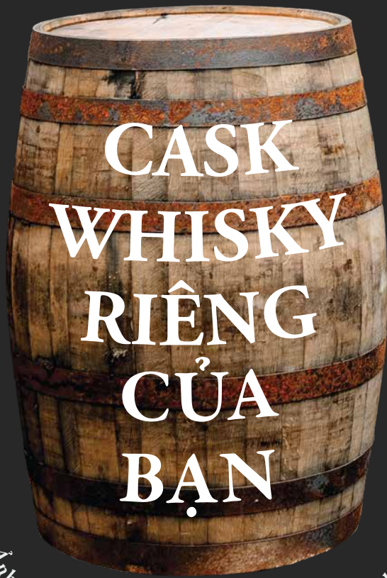
Ảnh: thùng rượu thực tế tại xưởng, và cũng là của bạn